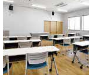
泥灘未來研修室 提供租借服務，可用來舉辦會議與店舖工作者的綜合研修室。65平方公尺 / 可容納36人(採取上課形式的情況)