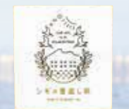
鶺鴒的報恩米 以自然共生為概念，由鶺鴒送來的感恩贈禮。