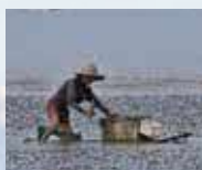
たかっぱ漁 (竹筒誘捕法) 從以前流傳至今的，捕捉大彈塗魚的傳統方法。