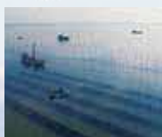
養殖海苔的風景 「佐賀海苔」的販賣數量、販賣額都是日本第一。