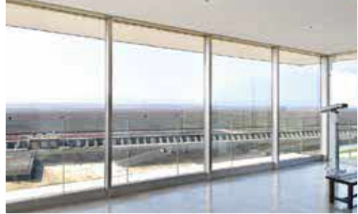
泥灘全景展望台 展望台南側是廣闊的泥灘，北側則是大片佐賀平原的風景，景色絕美。透過望遠鏡，也能看見棲息在泥灘地生物。