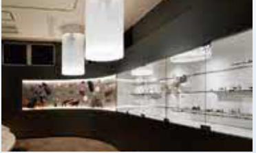
生物區 展示棲息在潮間帶的生物，也有透明骨骼標本以及少見的巢穴標本。抬頭往上看，可以看到.....