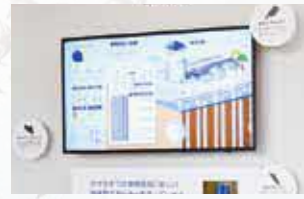
地熱空調系統螢幕 HIGASASU的空調使用地熱系統。可以透過螢幕觀察地熱的運作與節能狀況。