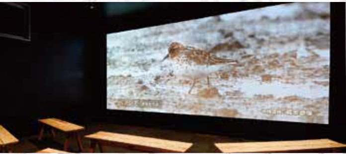
泥灘劇場 多達數千隻的野鳥群與泥灘特有的生物。透過美麗影片欣賞東與賀泥灘的四季。