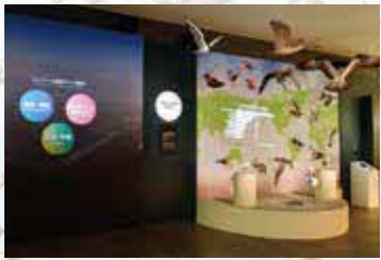
泥灘與野鳥區 展示拉姆薩國際濕地公約登錄證(正本)。了解泥灘的簡介，以及造訪此地的代表性野鳥。