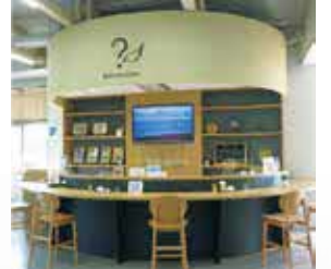
HIGASASU直播攝影機 可以即時觀看瞬息萬變的有明海泥灘風景。