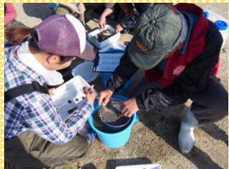
名前を調べています