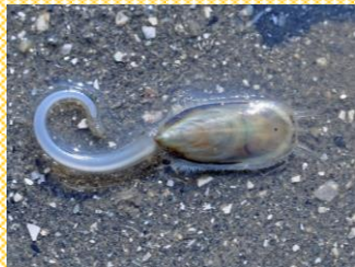
ミドリシャミセンガイ