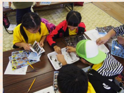
荒尾干潟で実施した干潟学習の様子（主催：WIJ、協力：荒尾市、鹿島市子どもラムサール観察隊）